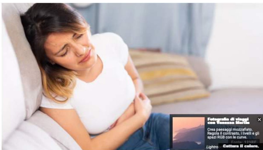
Malattie croniche intestinali in aumento

Dolori addominali, spossatezza, sanguinamenti, urgenza di recarsi al bagno anche più di dieci volte al giorno nelle fasi di "accensione" della patologia. Convivere con una MICI (la sigla sta per malattia infiammatorie croniche intestinali) come Crohn e colite ulcerosa può significare dover affrontare anche tanti problemi nella vita di tutti i giorni. Magari cominciando fin dalla giovane età, visto che circa un quarto di queste patologie manifesta i primi segni in età pediatrica.