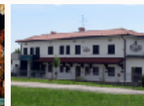
Prosciuttificio Il Camarin