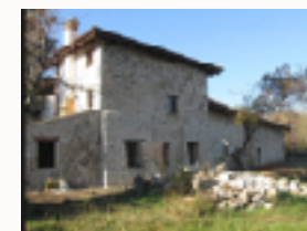
Hospitale S. Giovanni di Gerusalemme

è un complesso situato nella frazione di San Tomaso di Majano. Questo complesso dal 2004 è proprietà del comune. L'Hospitale è stato fondato alla fine del XII°sec. dai cavalieri di San Giovanni di Gerusalemme (poi cavalieri di Malta), nel periodo delle crociate, come risulta dalla pergamena istitutiva originale, del 1199, del "Portis". Costituiva una tappa importante della Via del Tagliamento nell'antica Via di Allemagna, che collegava l'Europa fino ai Paesi Baltici con i porti dell'Adriatico"