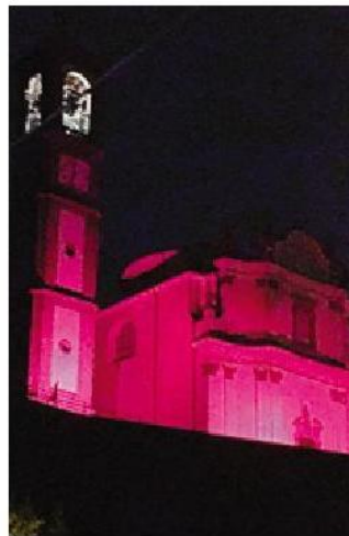
La chiesa illuminata