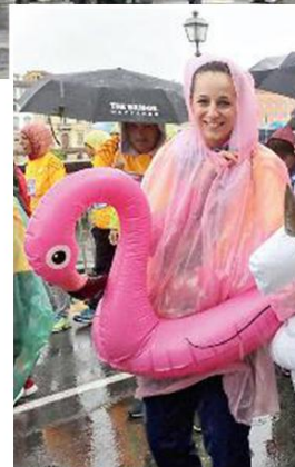
Strade allagate? Nessun problema, basta dotarsi di una ciambella