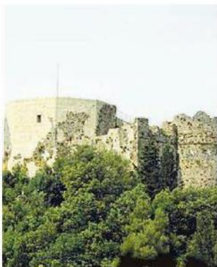
Il castello Aghinolfi

Da ieri fino alla della prossima settimana, infatti, il Ca-