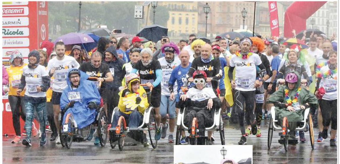
La partenza dei corridori della Deejay Ten sotto la pioggia

Poi, la corsa, dai lungarni al piazzale Michelangiolo, passando attraverso Porta Romana, via Maggio, ponte Santa Trinita, piazza Ognissanti, via della Vigna Nuova, Por Santa Maria, via Porta Rossa e piazza della Repubblica con lo striscione dell'arrivo in piazza San Giovanni-piazza del Duomo. Alla fine, una grande festa con 15mila vincitori.