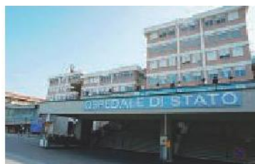
L'ospedale di San Marino

Quest'anno la giornata contro le Malattie infiammatorie croniche intestinali ha scelto come messaggio lo slogan "Rendere visibile ciò che è invisibile" e vede coinvolti 38 Paesi in tutto il mondo.